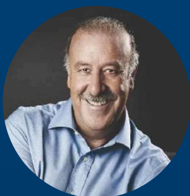
Vicente Del Bosque 西班牙前国家足球队主教练

武康大学是一所钟灵毓秀的学府，人才辈出，不论是工商界还是体育界，都有出类拔萃的人才，无论是国际校友还是本土校友都将是每一位武康学子的宝贵资源。