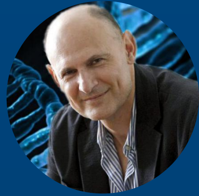
Juan Carlos Izpisua 美国著名生物科学家 《时代周刊》上榜科学家