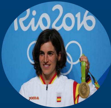
Maialen Chourraut 里约奥运女子激流回旋项目金牌得主