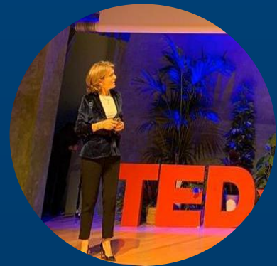
Estrella Núñez Delicado 西班牙生物教育学家， 武康大学名誉院长